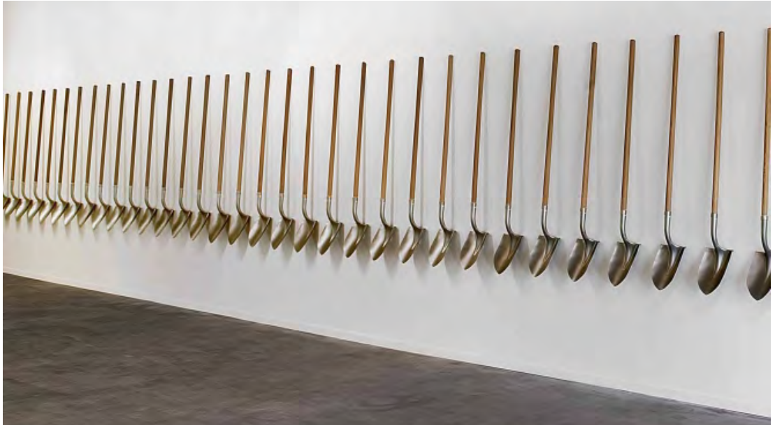
Pedro Reyes: Pelas por Pistolas (Gewehre zu Schaufeln), 2007 bis heute, © Pedro Reyes

Kunst ist schön und hängt an der Wand? Denkste! Der mexikanische Künstler Pedro Reyes hat Waffen in Schaufeln umgeschmolzen, um mit ihnen Bäume zu pflanzen. Die Schaufeln hängen als Kunstwerke in der Ausstellung – noch. Wir schnappen uns die Kunstschaufeln und lassen es in Bonn sprießen. Dafür wurde über Wochen ein beetgroßer Ausschnitt im Asphalt des ehemaligen Schulhofs vor dem Gebäude mit Hammer und Meißel entsiegelt. Nun ist alles bereit, ein „Grünes Zeichen“ zu setzen.