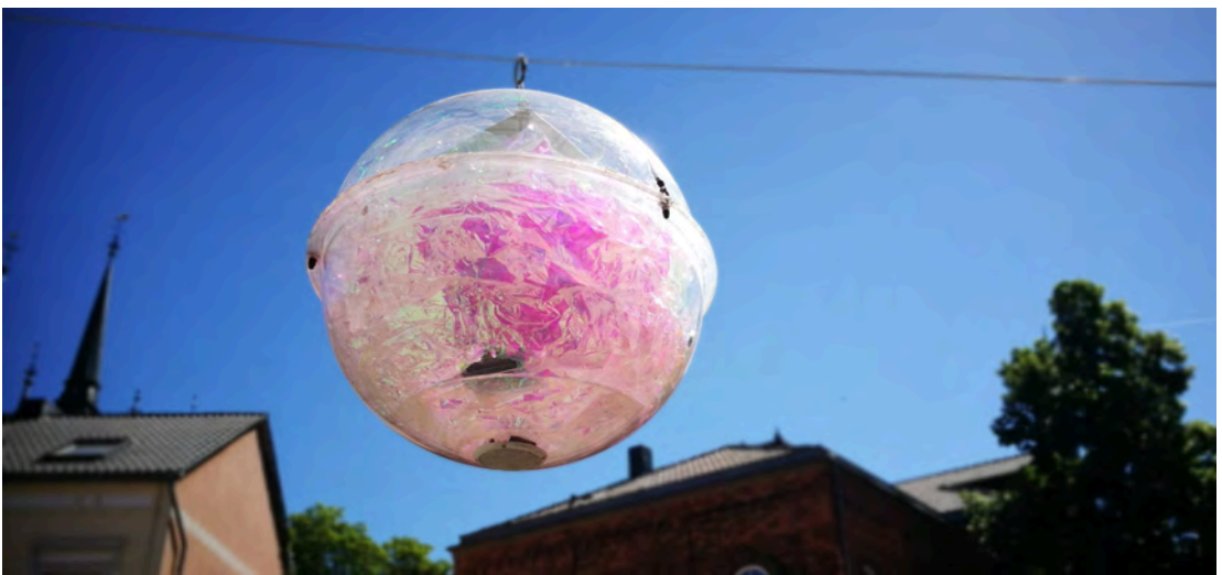
Marlen Liebau | Marc Lingk: Sonnengesänge, mixed media, 2003 © Deutsches Institut für Entwicklungspolitik, Foto: B. Westhoff

Vorab erkunden wir in gemeinsamen Familienrundgängen die Ausstellung: Was passiert mit unseren Plastiktüten? Wie lässt sich mit Filz sauberes Wasser gewinnen? Welche Schönheit steckt in einem winzigen Grashalm? Wie viele Liter Wasser fließen in die Herstellung einer Jeans und wer will die Fahrradwaschmaschine ins Schleudern bringen? Wir freuen uns auf den ereignisreichen Nachmittag mit Euch – schließlich ist Nachhaltigkeit ein zu wichtiges Thema, um es allein den Erwachsenen zu überlassen.